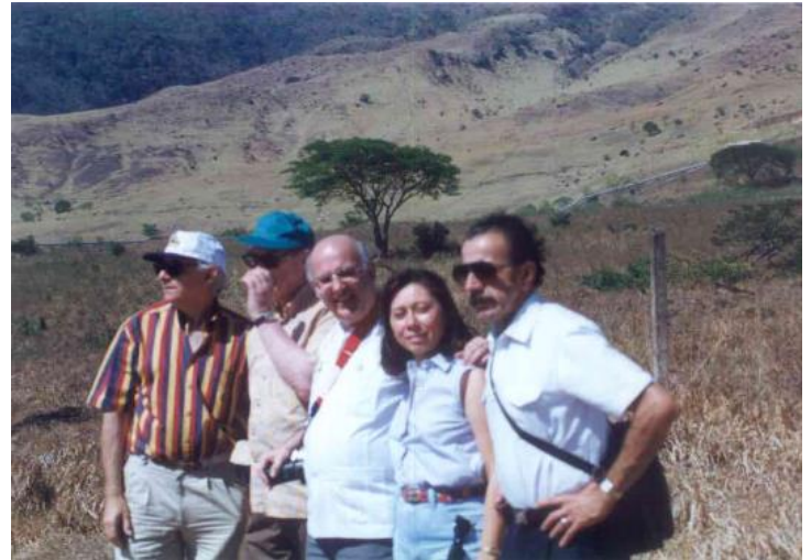
Actividades a las que asistió el Dr. Hans Blix, Universidad Nacional, Instituto Costarricense de Electricidad (visita a campo) y en ocasión de la visita al Teatro Nacional